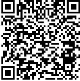
- QR code

à M. KONOPKA Jérémie, 82 av. de Fouilleuse - BAT B - app. 2108 92150 SURESNES