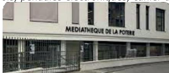
Le stage a lieu la Médiathèque de la Poterie 10 allée Jean-Baptiste Lully 92150 SURESNES

Supports pédagogiques : cours en vidéoprojecteur, exercices sur papier, échiquiers en bois, pendules électroniques, cahier du stagiaire.